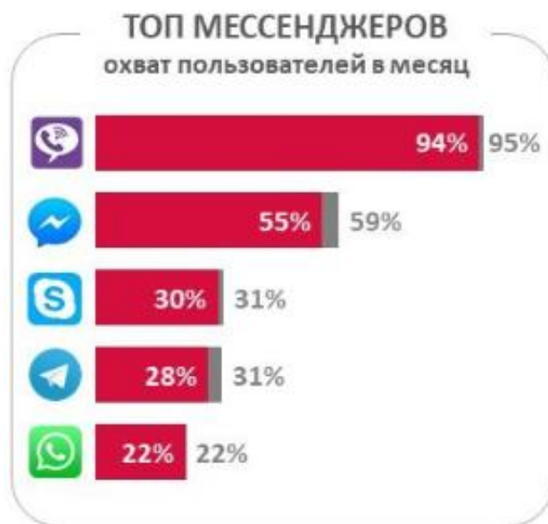
Рис. 1.2. Обсяг користувачів за лютий 2018 р. [18]

Також був створений рейтинг месенджерів та соціальних мереж компанією Admixer за даними дослідження TNS за лютий 2018 р. Беззастережне лідерство належить Viber, яким як мінімум раз на місяць користується 94% власників смартфонів (близько 40% всього населення України). Facebook Messenger займає друге місце з величезним відривом, а WhatsApp - один з найменш поширених месенджерів (див. Рис. 1.2.) [18].